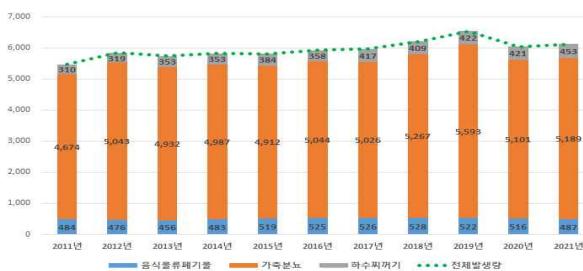
【 최근 유기성 폐자원 발생 현황 】